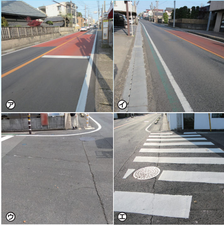
・写真ア・イ【藤崎・交通安全】道路修繕と歩道改修 ・写真ウ・エ【大久保・通学路安全】横断歩道の塗装