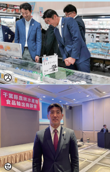
・写真ク…地元消費の促進(津田沼イオン) ・写真セ・ソ…海外商談会の推進(台湾)