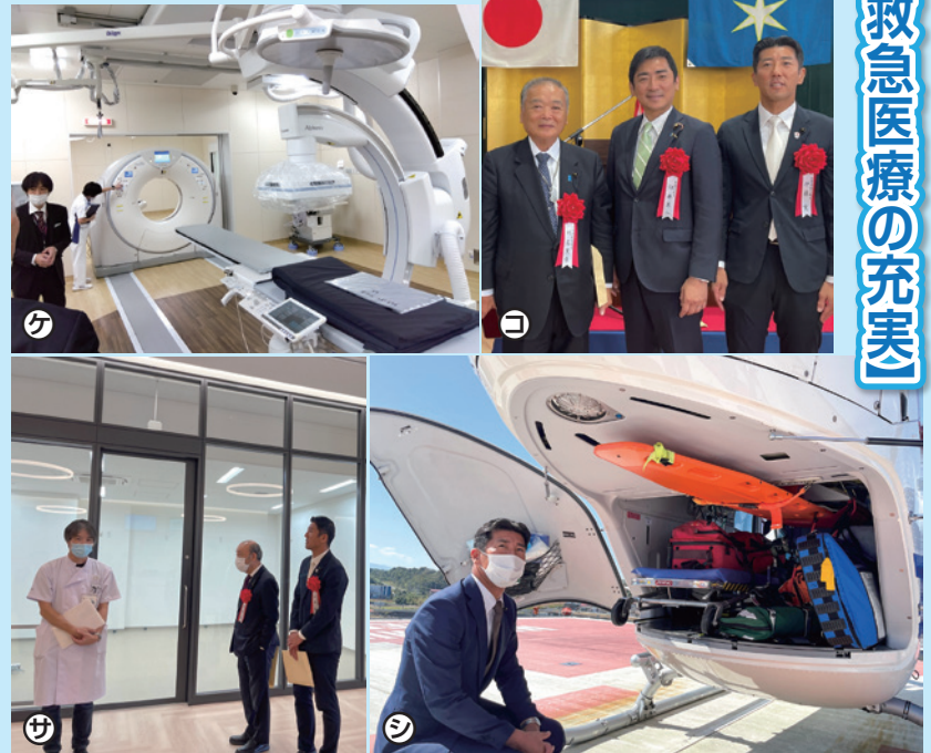
・写真カ・キ・ク…千葉県総合救急災害医療センター(千葉市美浜区豊砂) ・写真セ…ドクターヘリの医療体制(奈良県)