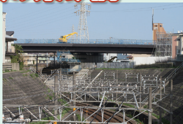
▲県道 藤崎茜浜線(鉄道 JR線・京成線跨線橋工事)