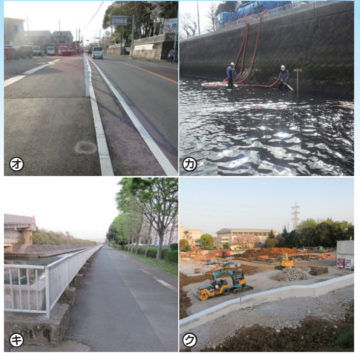
・写真オ【実籾・交通安全】歩道拡幅 ・写真カ・キ【秋津・香澄】堆積土砂撤去と歩道の部分修繕 ・写真ク【実籾本郷】児童養護施設と子ども短期間泊まり施設の建設