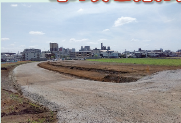
▲農地 鷺沼の開発(特定土地区画整理事業)