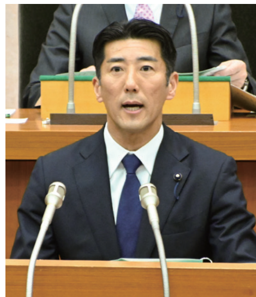
▲常任委員会 委員長報告

令和6年度は、私たちが暮らす千葉県・習志野市にとって節目の年となります。千葉県誕生150周年事業が、昨年度から県内市町村と連携して開催されており、習志野市では昨年度、自然と共生したまちを象徴する「谷津干潟」の清掃活動、ちば文化資産に「習志野ソーセージ」が選定されました。