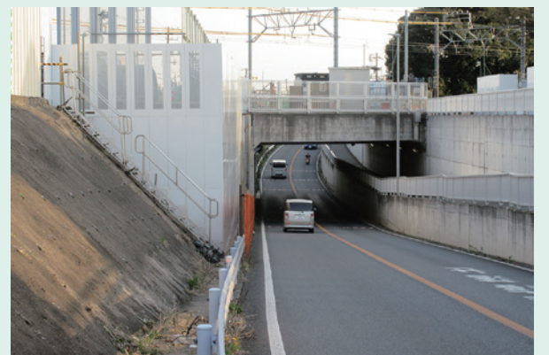
▲県道 東習志野実籾線(鉄道 京成本線立体交差工事)